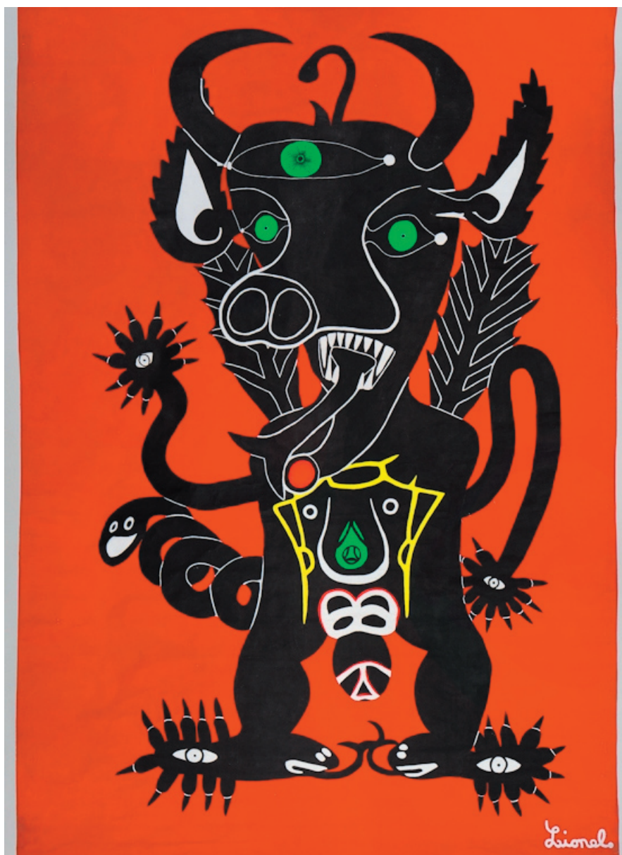
Le démon dictateur, bannière, 1981 Acrylique sur papier - 293x200,50cm - collection de l'artiste